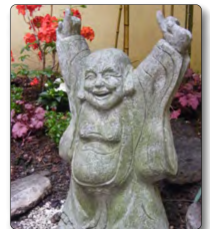
Glücks-Buddha im Zen-Garten