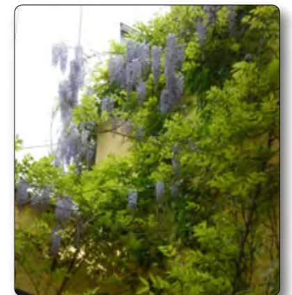
Ausblick vom Unterrichtsraum auf den Zen-Garten (Glyzinienblüte)